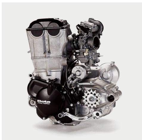
Beta verzichtet auf eine Einspritzanlage und verbaut stattdessen Keihin-Vergaser. Auffällig sind der niedrige Zylinder und der hohe Zylinderkopf.

Es ist denkbar, daß in naher Zukunft noch die eine oder andere Hubraumvariante dazu kommen wird. Außerdem bietet es sich förmlich an, weitere Beta-Modelle mit dem neuen Motor auszurüsten. Die Alp 125 wird ja zur Zeit von einem Yamaha-Single angetrieben, und in der Beta 200 sowie der Beta 4.0 arbeiten Einzylinder-Triebwerke von Suzuki, die schon etwas in die Jahre gekommen sind.