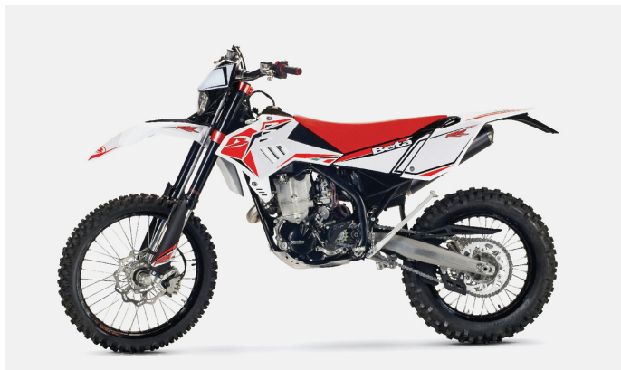
Die neue Beta RR ist in drei Hubraumvarianten mit 400, 450 und 500 Kubikzentimetern erhältlich.

Passend zu den neuen Motoren wurde ein adäquates Fahrwerk auf die Räder gestellt. Für den Rahmen verspricht Beta eine höhere Stabilität trotz geringeren Gewichts. Eine neue Marzocchi-Gabel mit 45 Millimetern Durchmesser soll die Vorderradführung deutlich verbessern. 30 Prozent mehr Festigkeit bei glei-